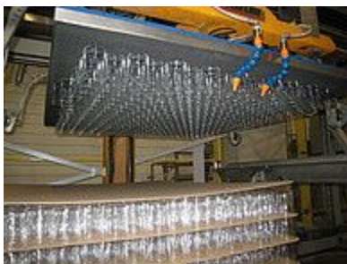
Захват для банок