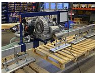
Захват для изделий деревянных изделий