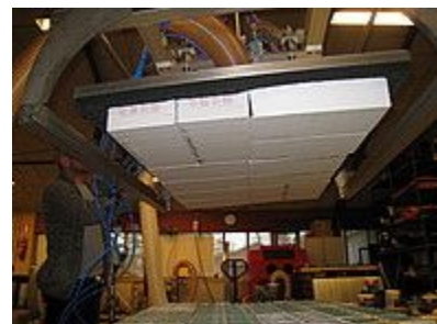
Захват для коробок

На фотографиях показаны возможности присосок VUSS захватывать самые разные грузы такие как, деревянные изделия, металлы и раскрой, банки и бутылки изделия из разных материалов, доски и фанеру, стекло и коробки.